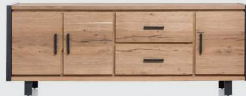
art. nr. 37154 DRESSOIR 3-deuren + 2-laden bxhxd 240x90x45 cm