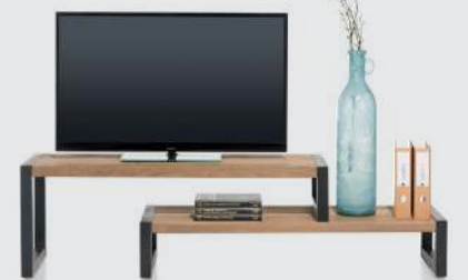
art. nr. 37141 TV-rek set bxhxd 187x50x42 cm