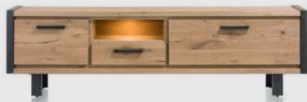
art. nr. 37138 Lowboard 1-lade + 2-kleppen + 1-niche (+LED) bxhxd 210x60x42 cm