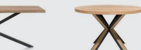
art. nr. 36479 OVADA Eetkamertafel bxhxd 230x77x100 cm