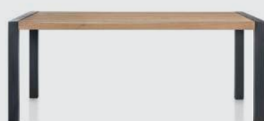
art. nr. 37153 Eetkamertafel bxhxd 180x77x100 cm