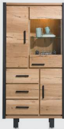
art. nr. 37146 Vitrine 1-glasdeur + 2-deuren + 3-laden (+LED) bxhxd 100x205x42 cm