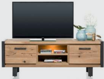
art. nr. 37137 Lowboard 2-kleppen + 2-niches (+LED) bxhxd 170x60x42 cm