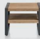
art. nr. 37151 Hoektafel 1-niche bxhxd 55x45x55 cm