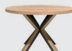
art. nr. 36481 OVADA Eetkamertafel bxhxd 130x77x130 cm