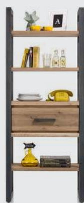
art. nr. 37143 Boekenkast 1-lade + 5-niches bxhxd 75x190x35 cm