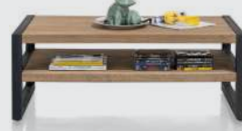
art. nr. 37144 Salontafel 1-niche bxhxd 120x40x60 cm