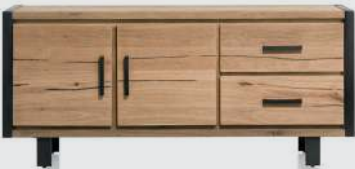
art. nr. 37150 DRESSOIR 2-deuren + 2-laden bxhxd 180x80x42 cm