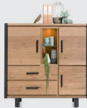
art. nr. 37135 Highboard 3-deuren + 2-laden + 2-niches (+LED) bxhxd 140x140x42 cm