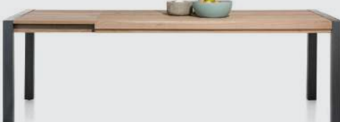
art. nr. 37155 Uitschuiftafel bxhxd 190/250x77x100 cm