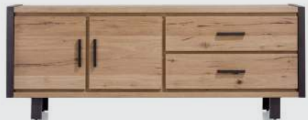
art. nr. 37136 DRESSOIR 2-deuren + 2-laden bxhxd 210x80x42 cm