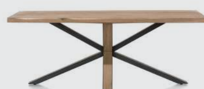
art. nr. 36478 OVADA Eetkamertafel bxhxd 200x77x100 cm