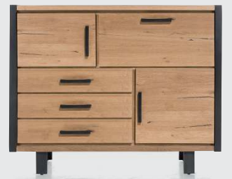
art. nr. 37134 Dresette 2-deuren + 3-laden + 1-klep (+LED) bxhxd 150x120x42 cm