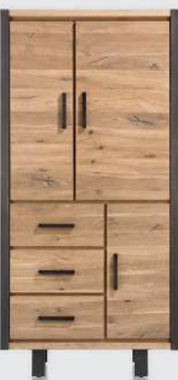
art. nr. 37142 Bergkast 3-deuren + 3-laden bxhxd 100x205x42 cm